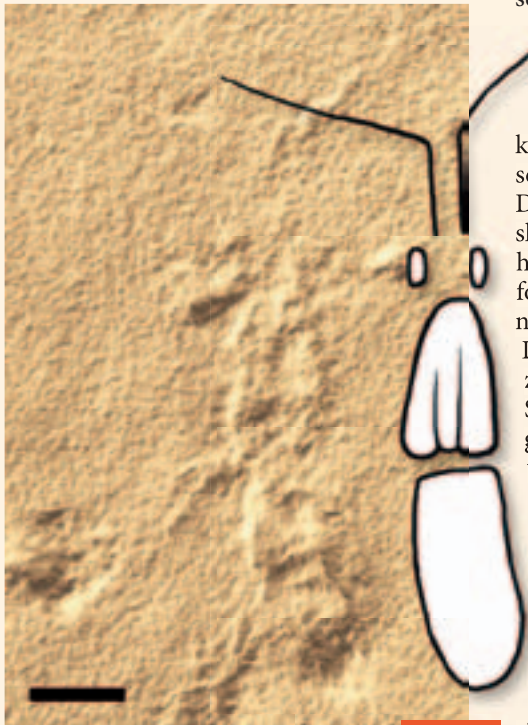
Abb. 2: Holotypus und Skizze von Tripartichnus imbergi . Maßstab 10 mm.

Tripartichnus imbergi aus den Plattenkal-ken von Pfalzpaint besitzt einen annähernd rechteckigen Gesamtumriss. Der vordere Abschnitt dieser Art besteht aus zwei paar-ig angeordneten, antennenartigen Ein-drücken und zwei kleinen Ovalen. Wie bei Tripartichnus triassicus besitzt der mittlere Abschnitt einen wappenschildartigen Um-riss und kann Längsfurchen enthalten. Das letzte Segment weist einen rechteckigen bis quadratischen Umriss auf und ist nicht wei-ter unterteilt (Abb. 2).