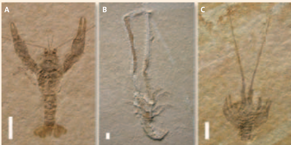
Abb. 4: Mögliche Erzeuger von Tripartichnus imbergi aus den Solnhofener Plattenkalken. Maßstab je 10 mm. A: Eryma modestiforme . B: Mecochirus longimanatus . C: Palinurina longipes .

Eine weitere, häufig vorkommende Gattung ist Mecochirus (Abb. 4b). Gegen sie als möglichen Erzeuger sprechen die gleichen Gründe wie bei Eryma . So sind die erwachsenen Exemplare von Mecochirus deutlich größer als die Spurenfossilien. Die Spuren müssten