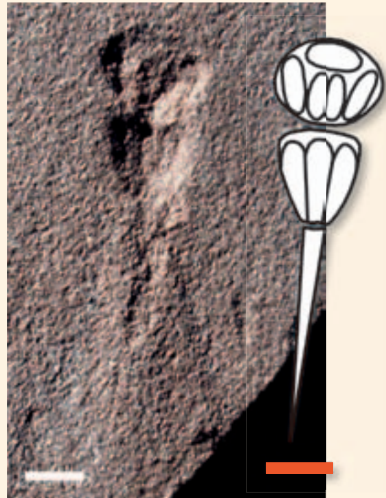
Abb. 1: Holotypus und Skizze von Tripartichnus triassicus . Maßstab je 10 mm.

Die kürzlich wissenschaftlich neu beschriebene Ruhespur ist als eine flache Eintiefung auf der Sedimentoberfläche ausgebildet und deutlich in einen vorderen, mittleren und hinteren Abschnitt unterteilt (Abb. 1, Abb. 2). Deshalb wurde sie als Tripartichnus bezeichnet (VALLON & RÖPER 2006). Tripartichnus triassicus aus dem Bunt-